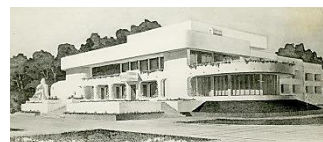
г. Волгодонск. Гостиница для иностранных специалистов

Награждён орденом Отечественной войны I степени и десятью медалями