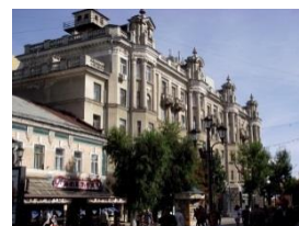
1956 г. Саратов. Жилой дом на пр. Кирова, 6/8