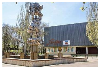
1980 г. Волгодонск. Парк и кинотеатр Победы