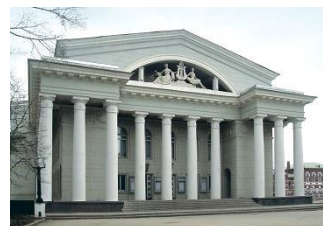
1962 г. Саратов. Театр оперы и балета им. Н.Г. Чернышевского

Архитектурное наследие Ботяновского Т.Г. – огромное и уникальное.