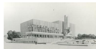
Ростов-на-Дону. Проект Дома кино на Театральном спуске