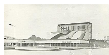
Ростов-на-Дону. Проект реконструкции пл. Дружинников, 1975-76 г.