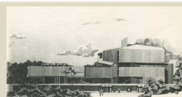
Дипломный проект «Дом кино»