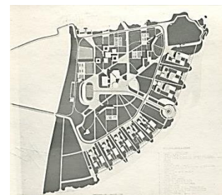
Ростов-на-Дону. Пионерская республика на Зелёном острове (соавтор), конкурс 1974 г. (поощрительная премия)